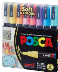
8 cores PC-3M 1 P4 51 P2 P11 8 P33 P6