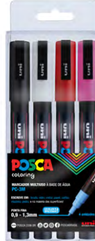
4 cores PC-3M Cores Sortidas