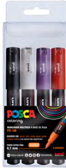
4 cores PC-1M Cores Sortidas