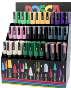
Tamanho: 36 x 24 x 17,5 cm 72 unidades (PC-5M)