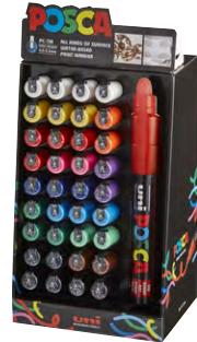
Tamanho: 45 x 20 x 15 cm 36 unidades (PC-7M)