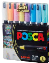
8 cores PC-1MR 1 P4 51 P2 P11 8 P33 P6