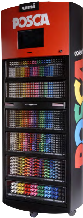
Tamanho: 200 x 85 x 64 cm 1.236 unidades (Sortidas)