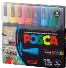
8 cores PC-5M 1 2 13 15 33 8 6 24