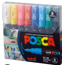
8 cores PC-1M 1 2 13 15 33 8 6 24