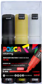
3 cores PC-8K Cores Sortidas