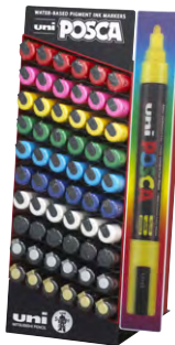
Tamanho: 33 x 14 x 16 cm 60 unidades (PC-5M)