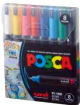
8 cores PC-1MR 1 2 13 15 33 8 6 24