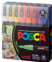
16 cores PC-3M 1 2 13 15 33 8 6 24 4 5 12 21 37 45 26 25