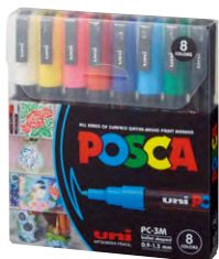
8 cores PC-3M 1 2 13 15 33 8 6 24