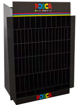
Tamanho: 55 x 37 x 25 cm 350 unidades (Sortidas)