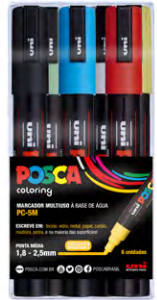
6 cores PC-5M Cores Sortidas