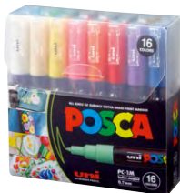
16 cores PC-1M 1 2 13 15 33 8 6 24 4 5 12 21 37 45 26 25