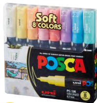
8 cores PC-1M 1 P4 51 P2 P11 8 P33 P6