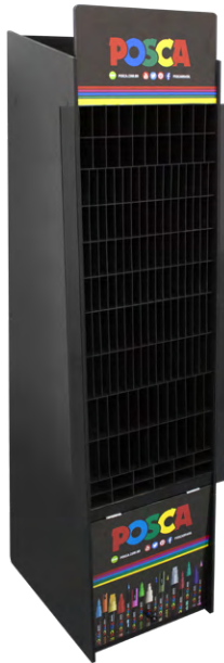
Tamanho: 155 x 45 x 37 cm 700 unidades (Sortidas)