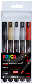
5 cores PC-1MR Cores Sortidas