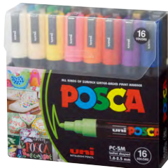
16 cores PC-5M 1 2 13 15 33 8 6 24 4 5 12 21 37 45 26 25