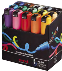
15 cores PC-7M Cores Sortidas