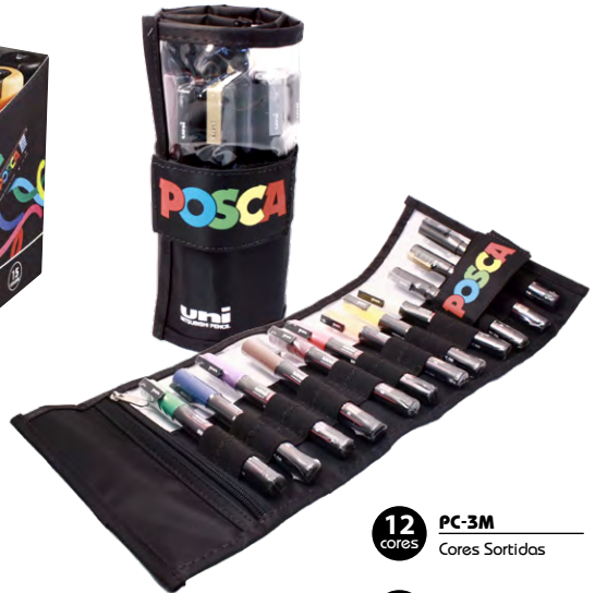
12 cores PC-3M Cores Sortidas