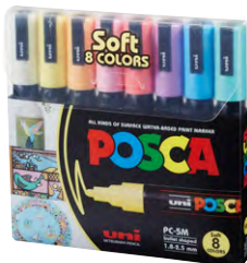
8 cores PC-5M 1 P4 51 P2 P11 8 P33 P6